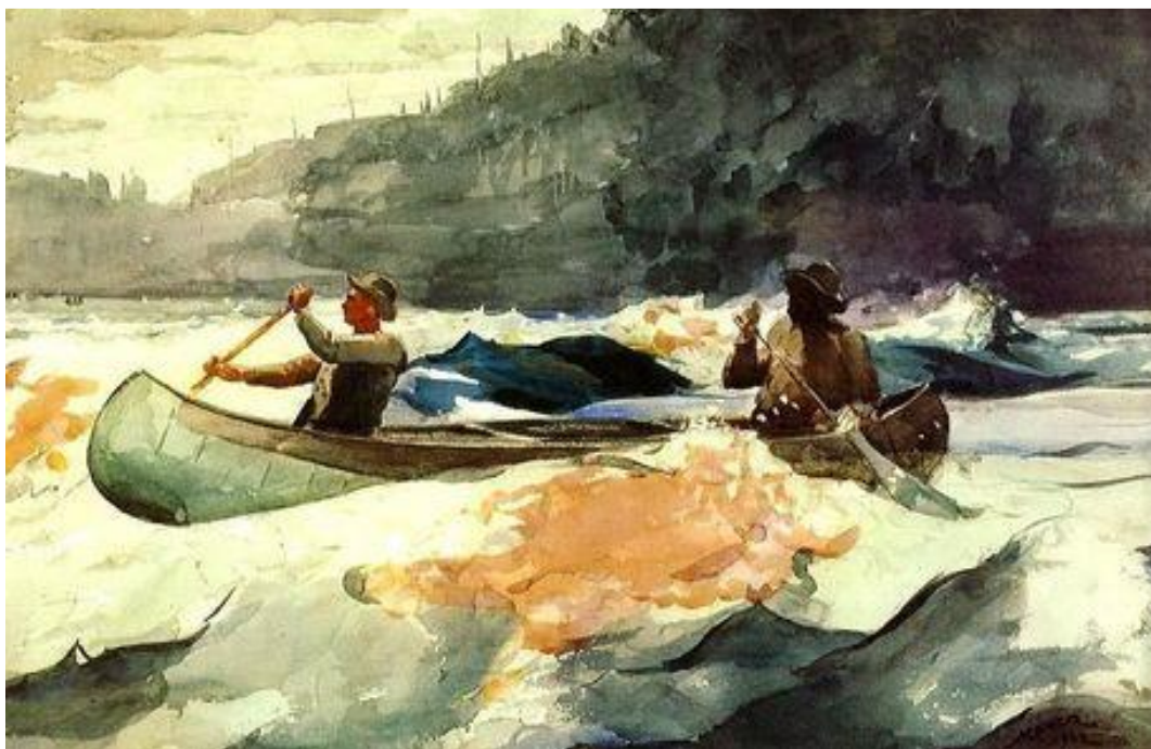
Winslow Homer (1836 - 1910) Shooting the rapids